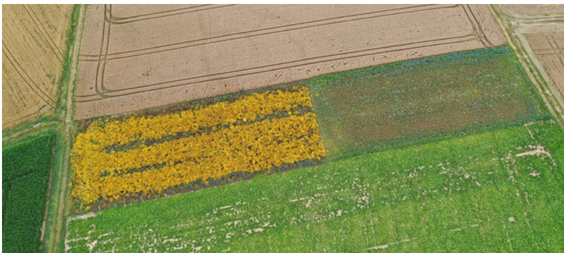
Abbildung 3: Geteilte, strukturreiche Blühfläche im Sommer.

wie leicht das Gelege gefunden werden kann und wie oft ein Prädator in der Nähe vorbeikommt (Bro et al. 2000b; Potts 2012).