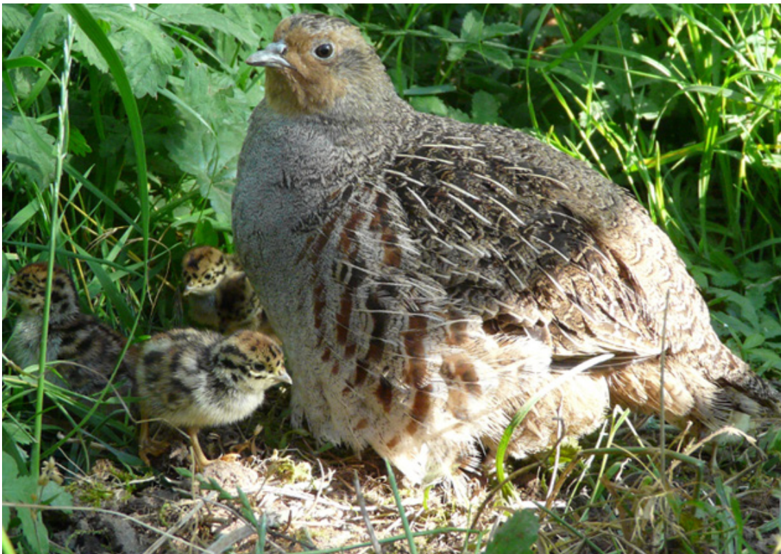
Abbildung 2: Rebhenne mit Küken.