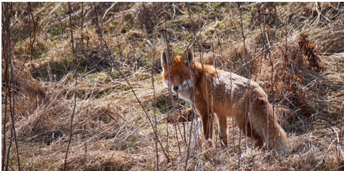
Abbildung 4: Rotfuchs.

und Ansitzeinrichtungen liegen. Zeitlich sollte der Schwerpunkt der Bejagung im Spätwinter zum Ende der Jagdzeit (je nach Bundesland) liegen, um die Prädatorenbestände vor Beginn der Brutzeit so weit wie möglich abzusenken. Im Anschluss ist die Verhinderung der Raubsäugerreproduktion wichtig, beispielsweise durch die vollständige Entnahme von Fuchsgehecken.