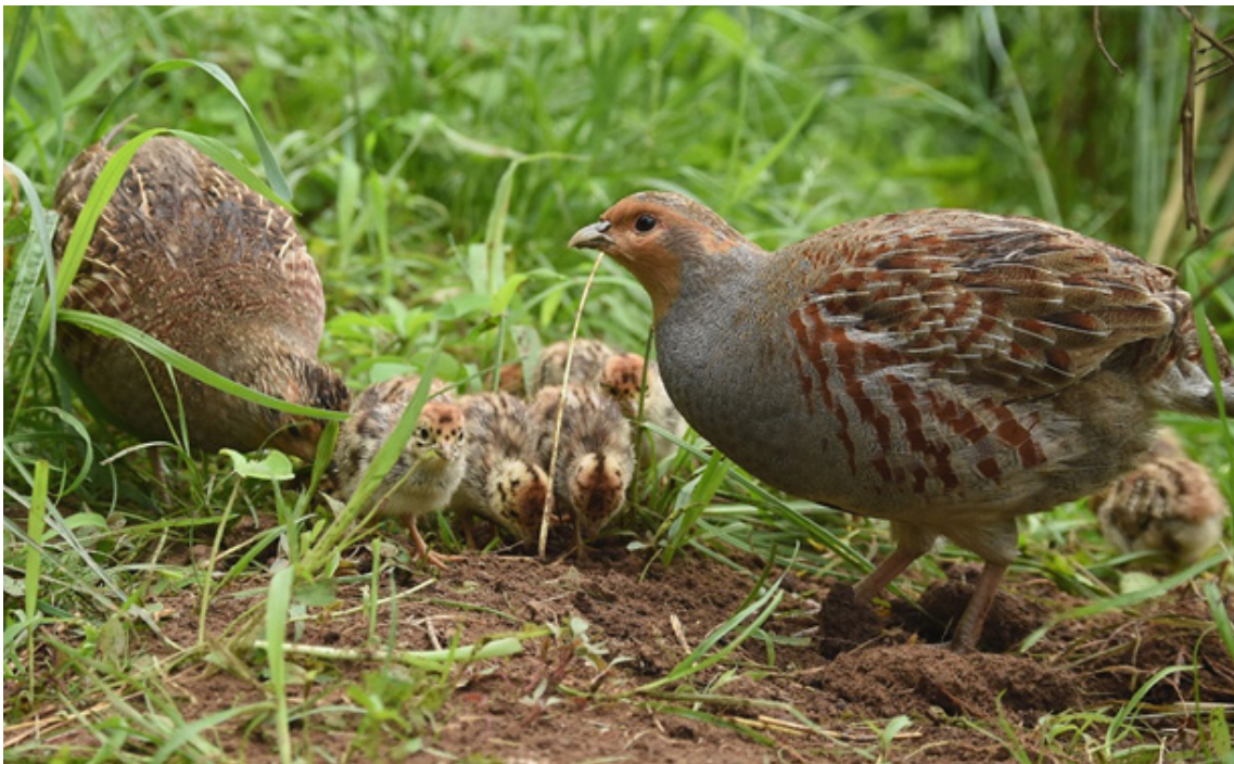
Abbildung 1: Rebhuhnfamilie mit kleinen Küken.